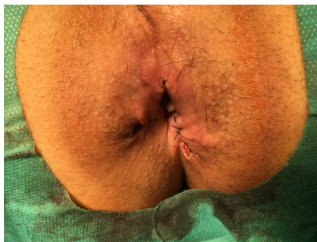
Ryc. 2. Obraz kanału odbytu po zabiegu Fig. 2. Image of the anal canal after the procedure