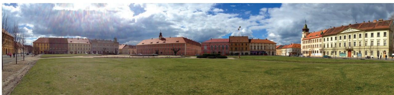
Ryc. 3. Panorama rynku w Terezynie. Stan obecny. Autor: Maria Ciesielska