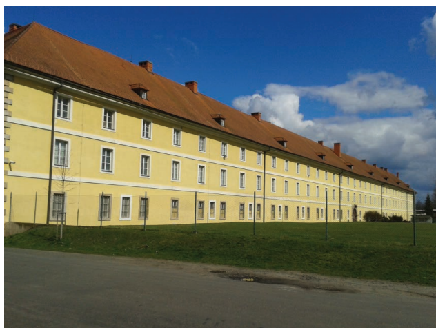
Ryc. 2. Baraki Magdeburskie, miejsce posiedzeń Judenratu. Stan obecny.